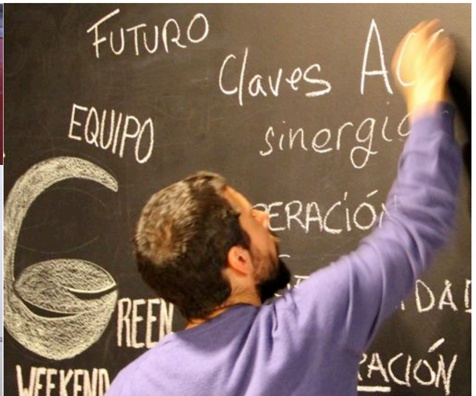
Futuro, equipo, sinergias, cooperación, innovación, etc. son algunos de los términos que sugieren los participantes